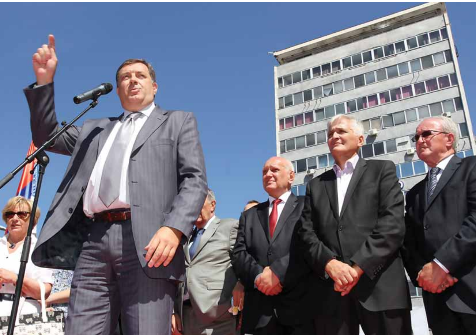
Локални избори | Бања Лука, 2012. година