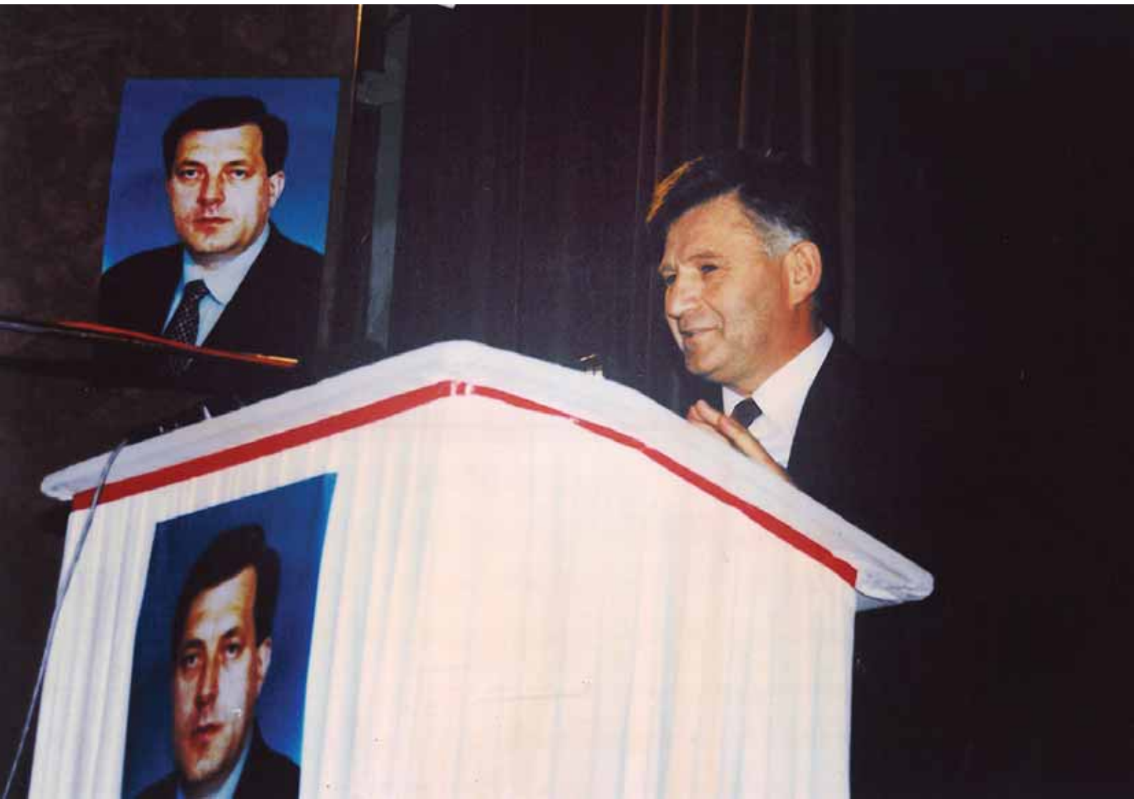
Ненад Баштинац | Први генерални секретар СНСД-а и један од оснивача