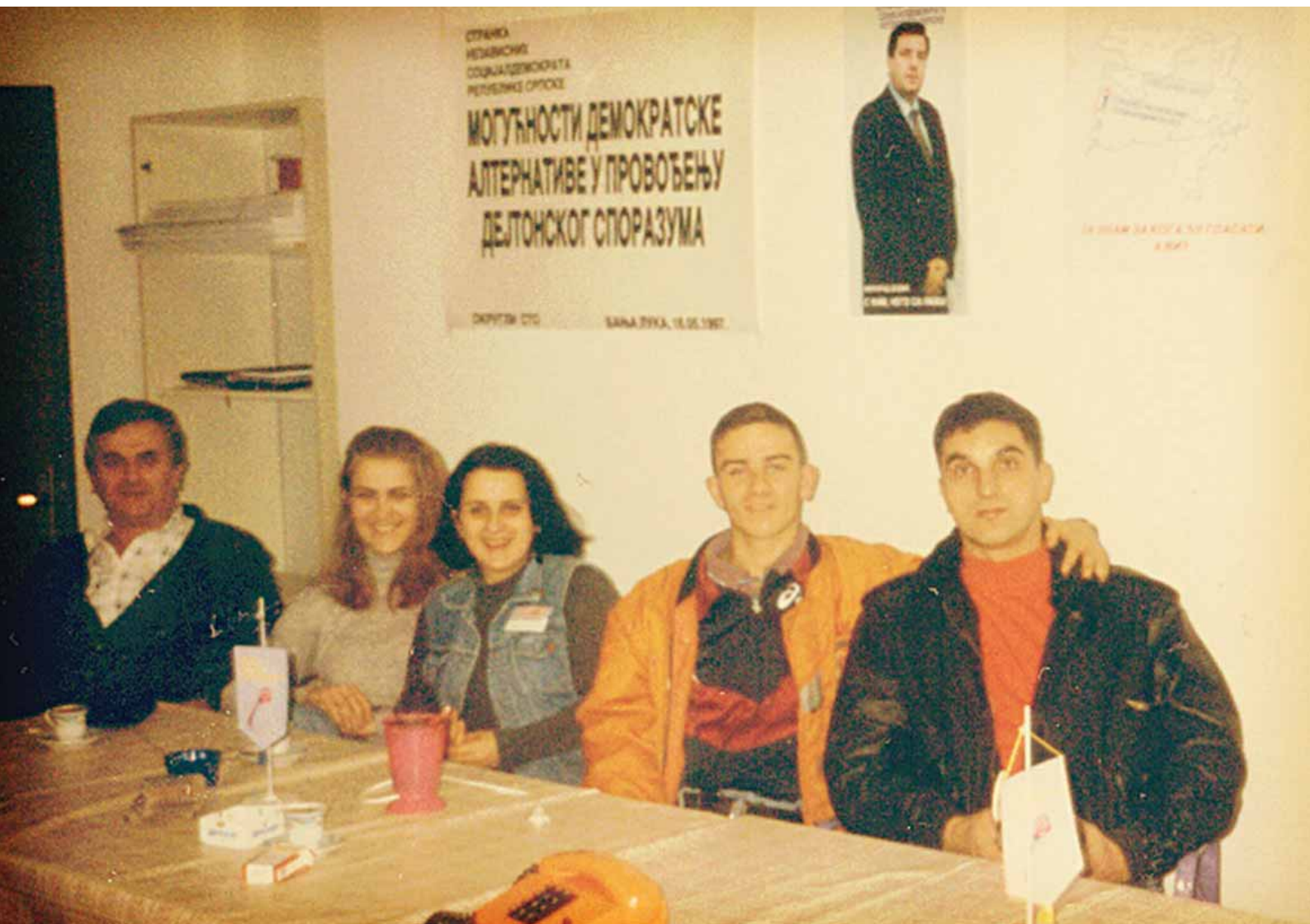
Важна подршка свим кампањама из канцеларије СНСД-а