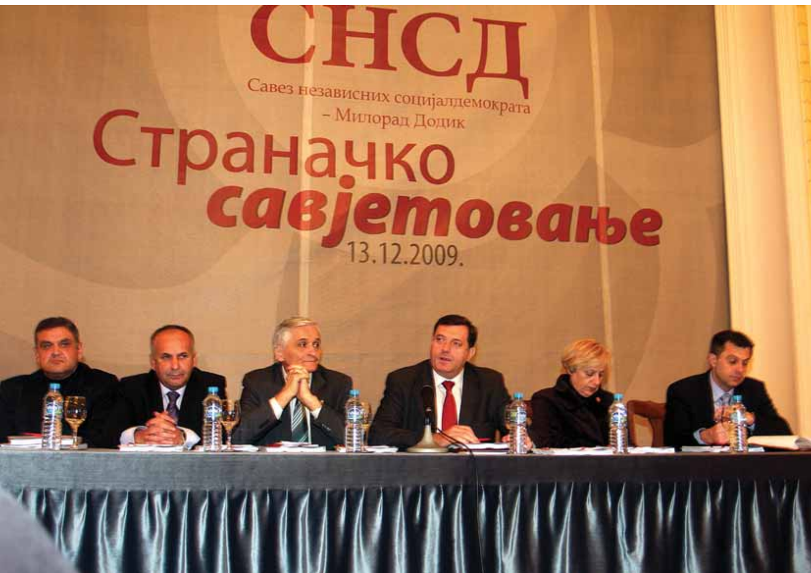
Страначко савјетовање | Требиње, 2009. година