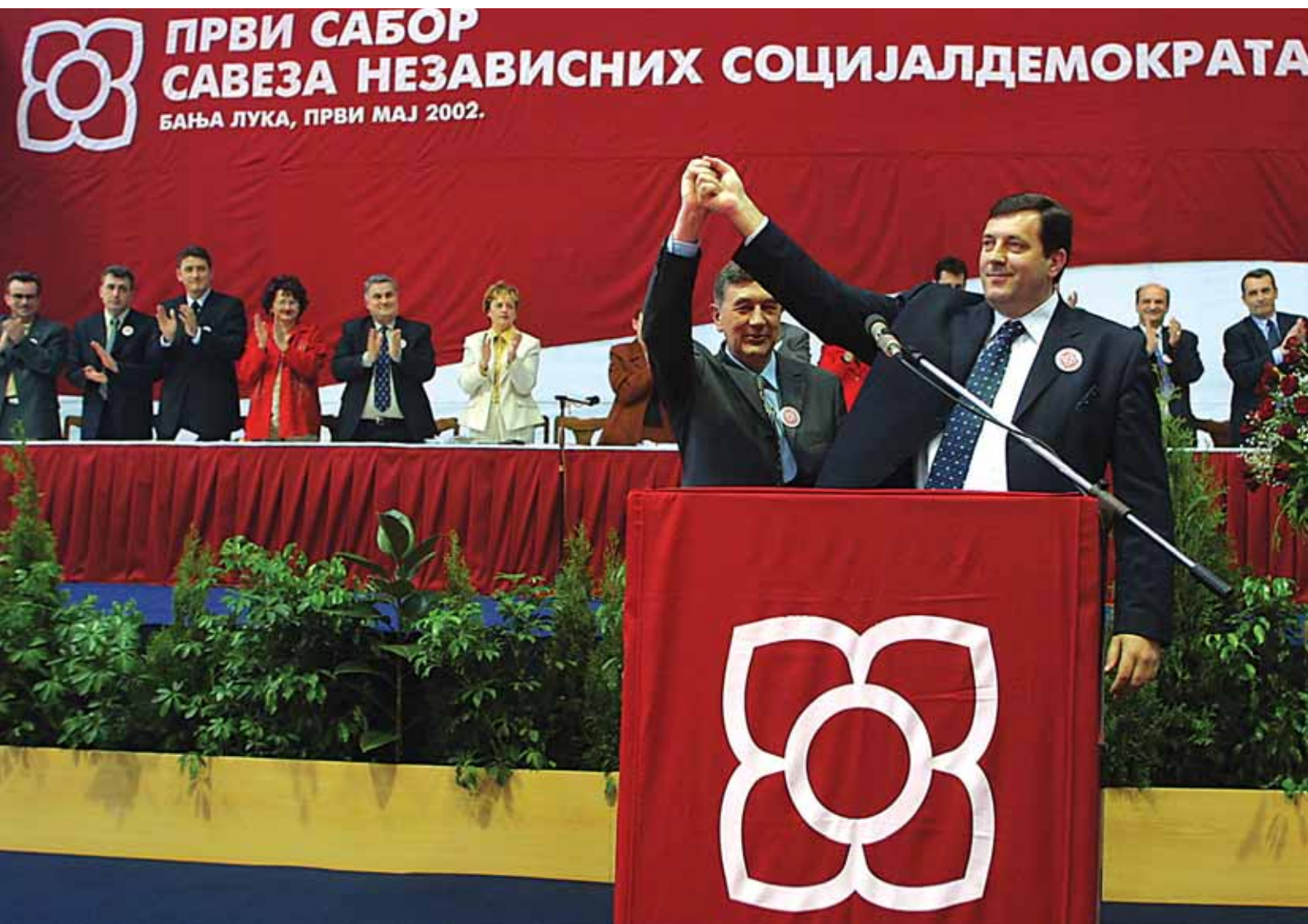
Сабор уједињења | Први сабор Савеза независних социјалдемократа