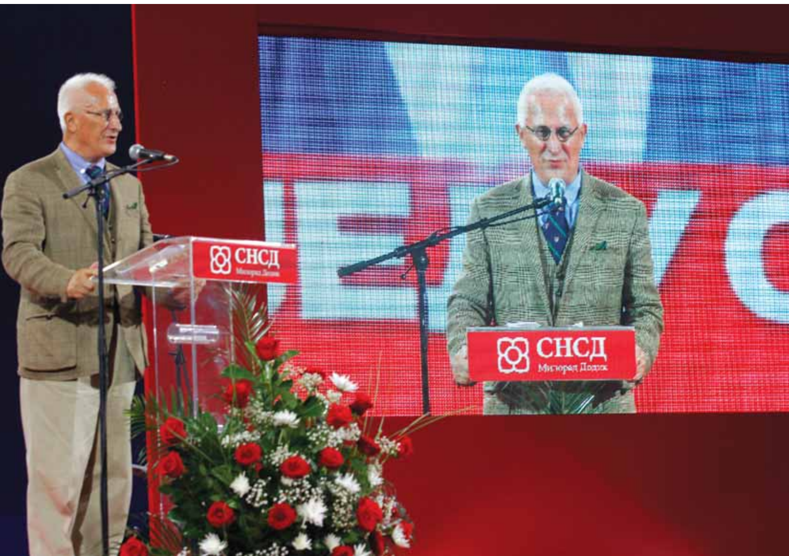
Матија Бећковић | Подршка СНСД-у