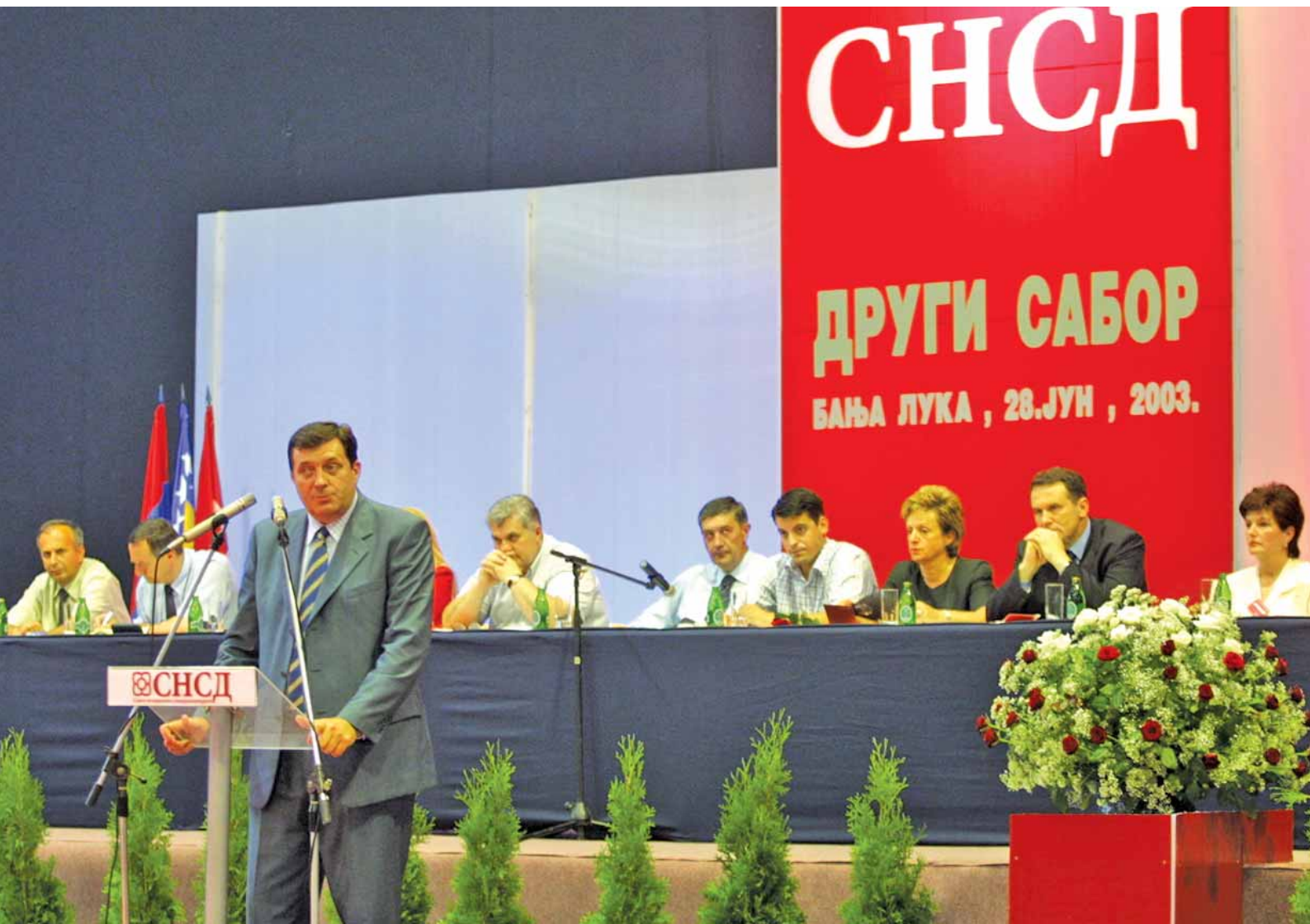
Други сабор СНСД-а | 2003. година