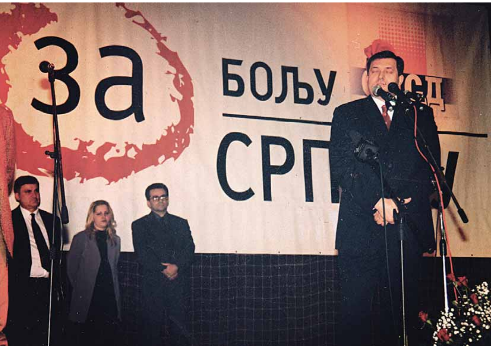
Из кампање 2000. године