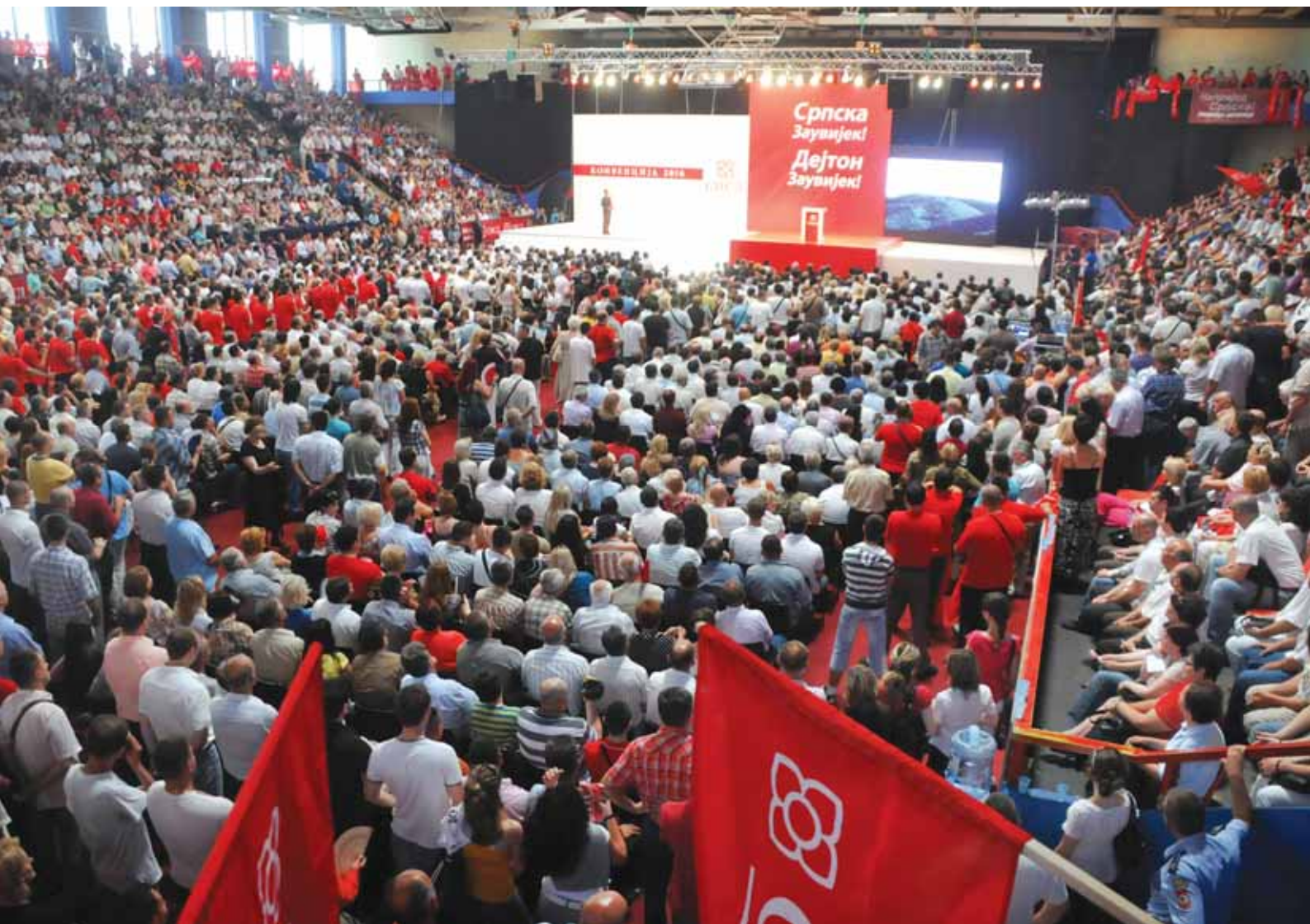
„Српска заувјек” | кампања за опште изборе 2010. године