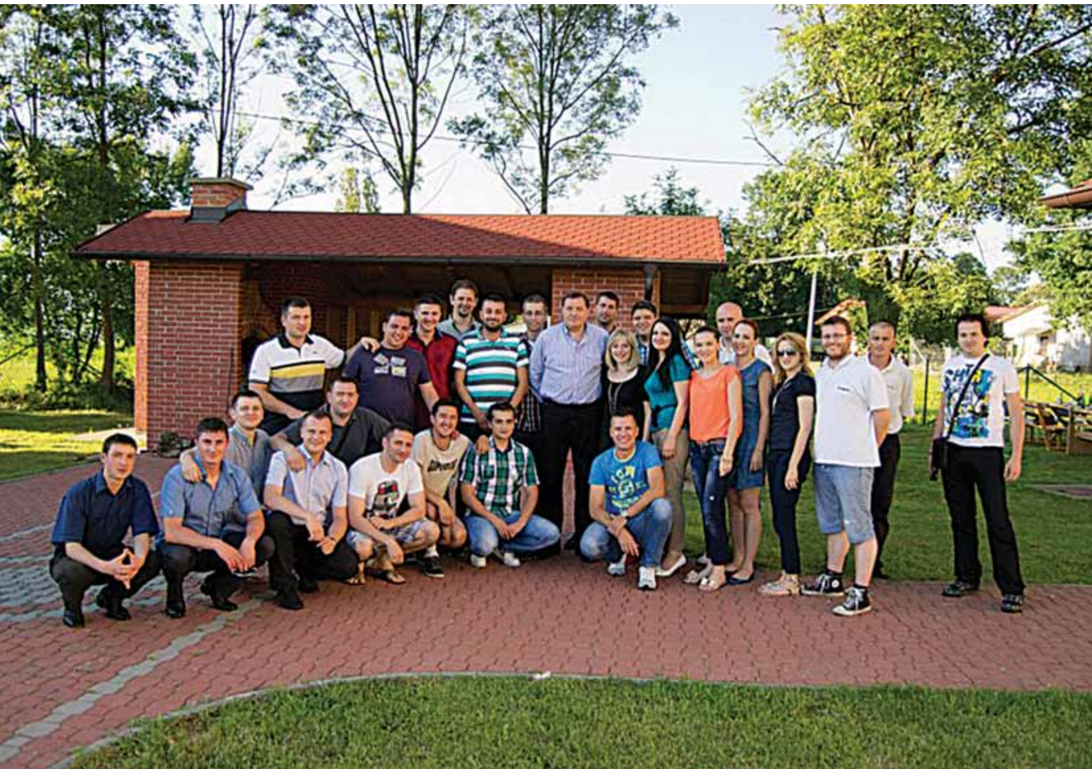
Млади социјалдемократи - снага СНСД-а