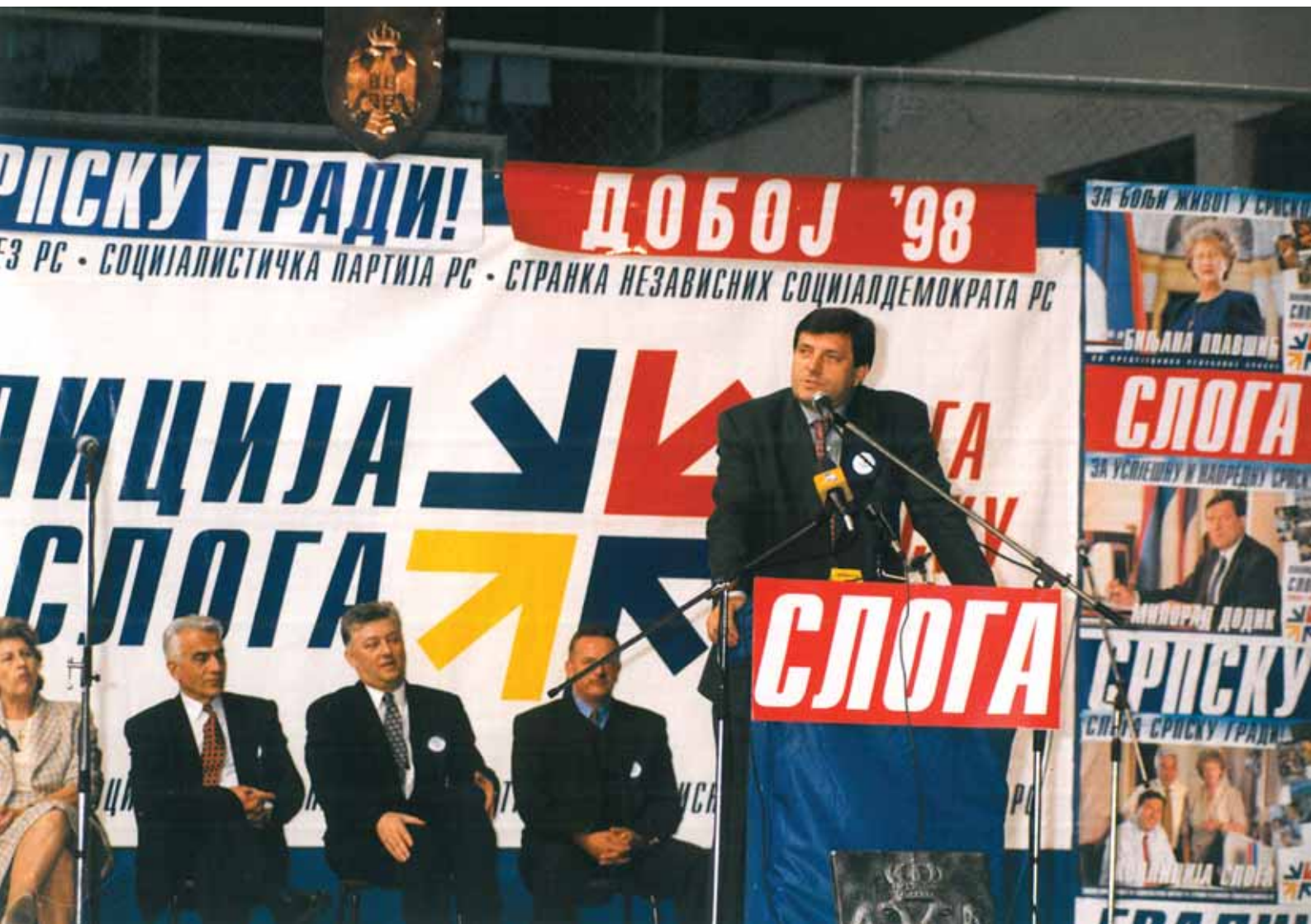
Милорад Додик | Говори на митингу коалиције „Слога”