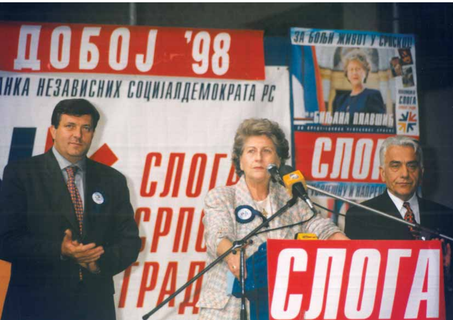
Милорад Додик, Биљана Плавшић и Живко Радишић | Лидери коалиције „Слога“