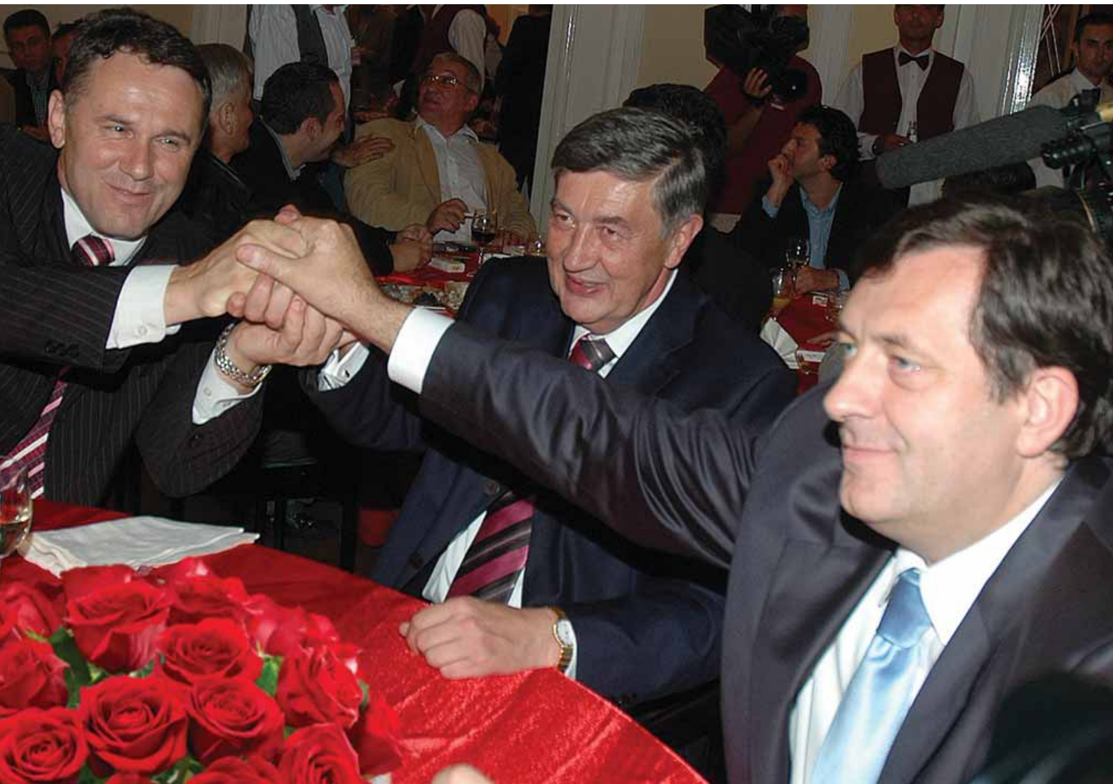
Побједници | Милорад Додик, Небојша Радмановић и Милан Јелић