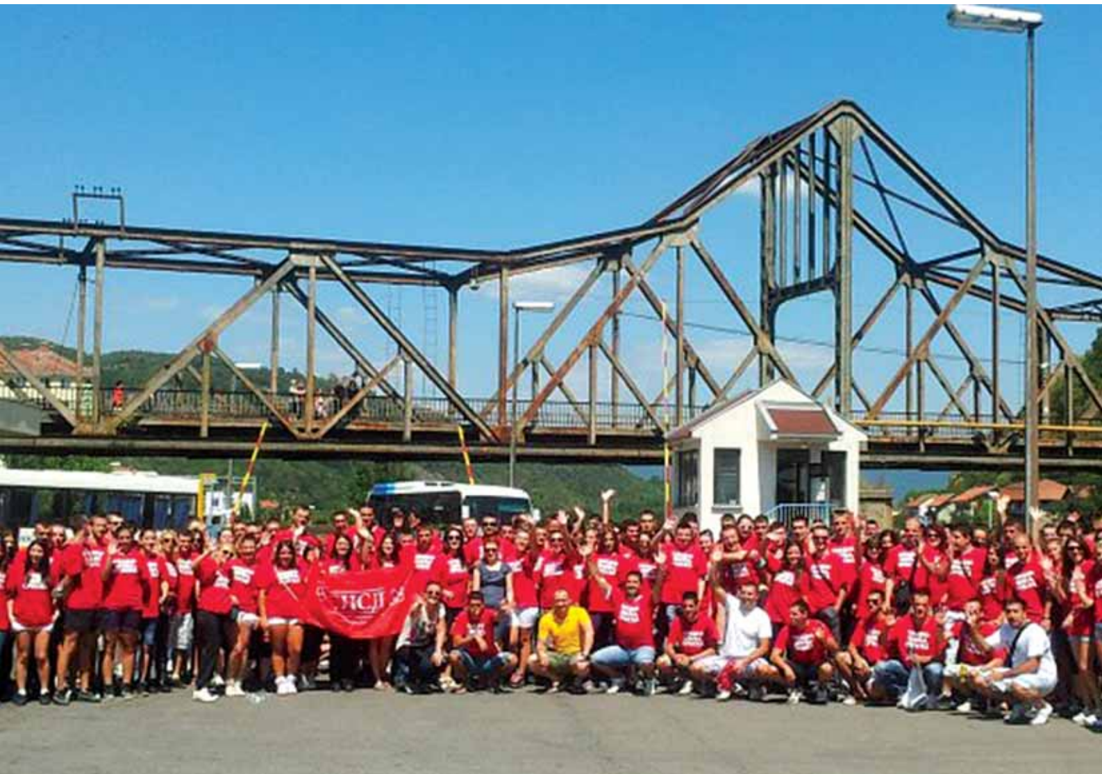
Млади социјалдемократи - снага СНСД-а