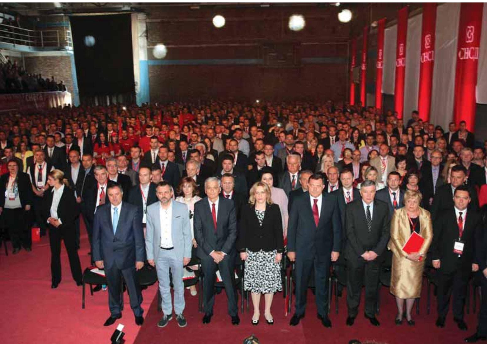
Пети сабор СНСД-а | 2015. година