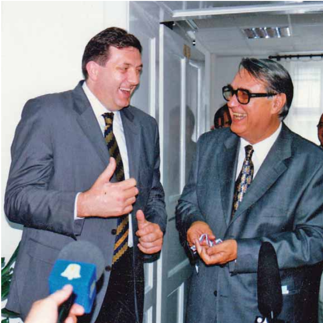
Милорад Додик и Рајко Кузмановић