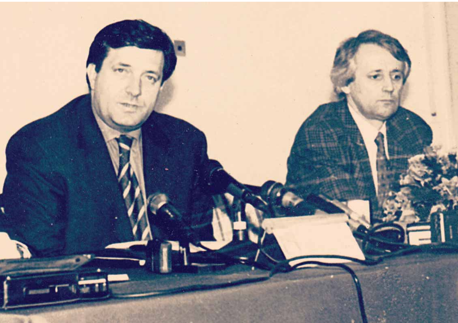
Милорад Додик и Рајко Васић