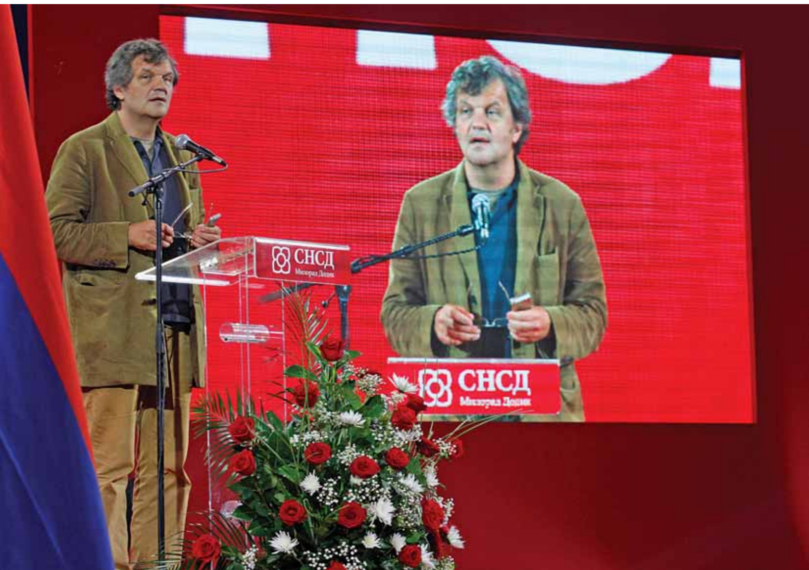
Емир Кустурица | Подршка СНСД-у