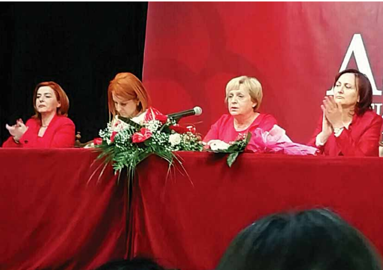
Актив жена социјалдемократа