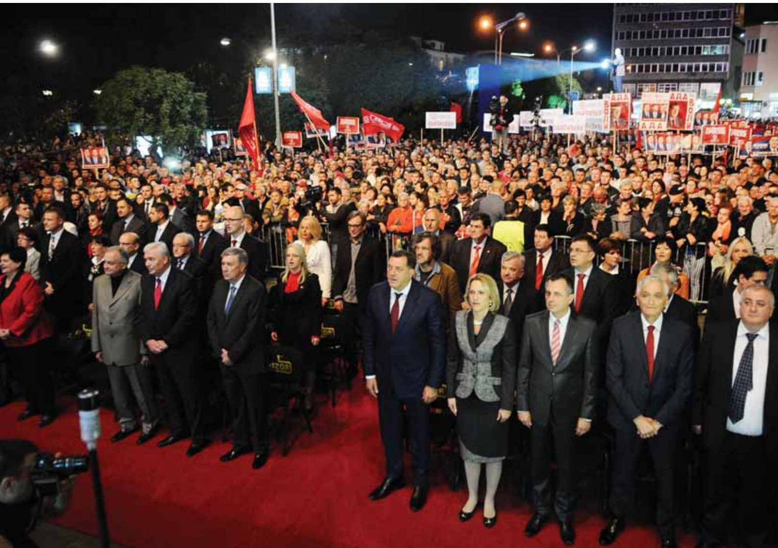
Завршни митинг, кампања за опште изборе | Бања Лука, 2014. година