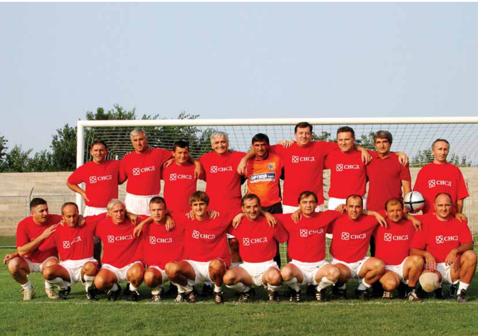
Екипа | Фудбалска екипа СНСД