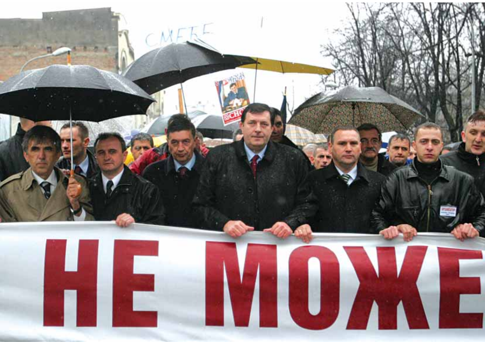
Протести | 23.03.2004. године