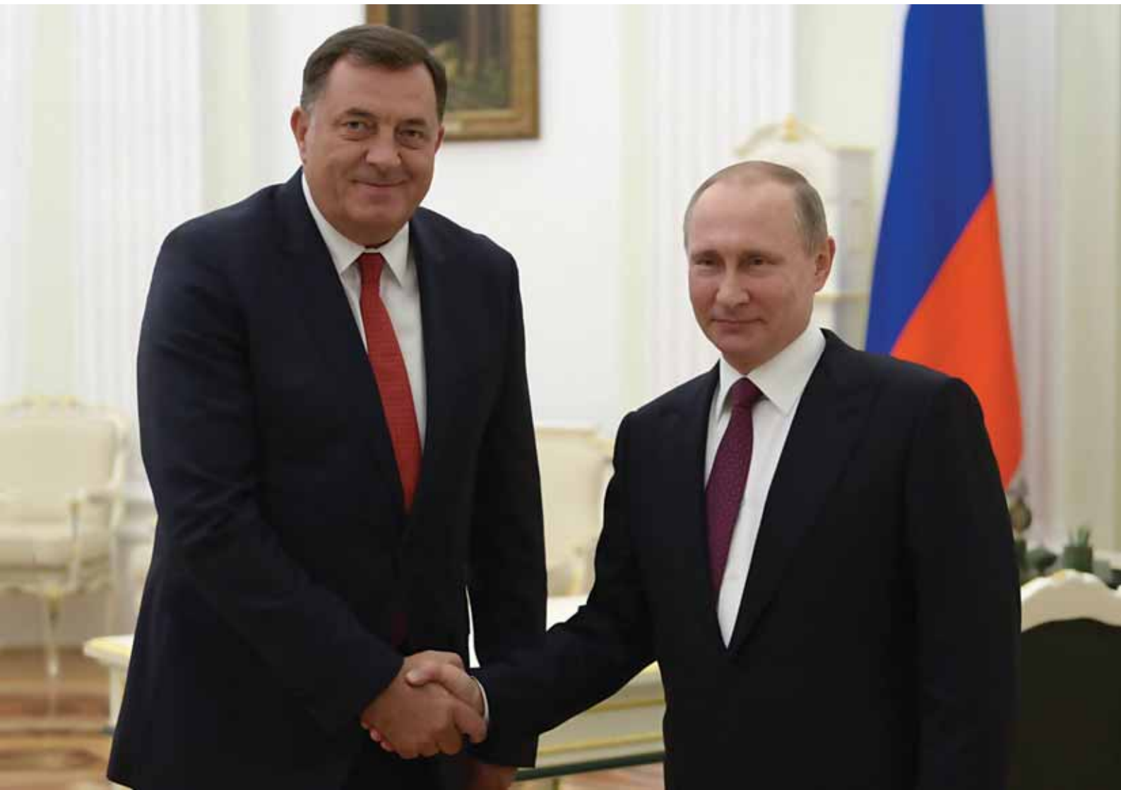
Милорад Додик и Владимир Путин