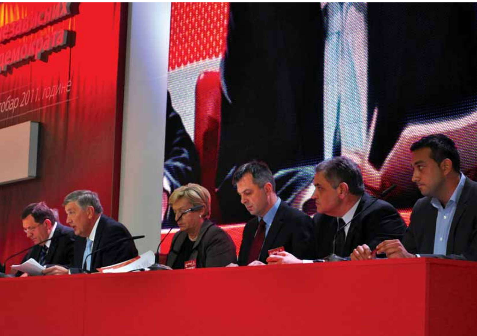
Четврти сабор СНСД-а | 2011. године